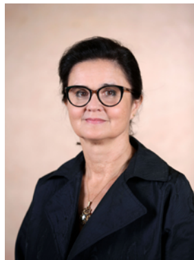
Bundesministerin Mag.ª Dr.ª Brigitta Zarfl

Zur finanziellen und sozialversicherungsrechtlichen Absicherung der betroffenen Personen sind gesetzliche Begleitmaßnahmen vorgesehen. Den Arbeitnehmerinnen und Arbeitnehmern steht – neben dem entsprechend der Arbeitszeitreduktion gebüh-